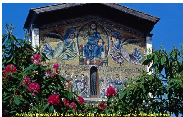
Basilica di San Frediano . Veduta del mosaico della facciata durante la Festa di S. Zita